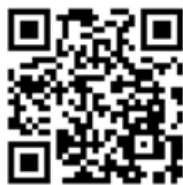
空メール専用QRコード

迷惑メール判定テスト用（空メール用）QRコードを読み取り、表示されたメールアドレス check@r-call119.jp 宛に、空メールを送信してください。